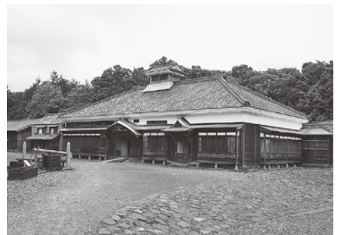
札幌市 北海道開拓の村 旧青山家漁家住宅