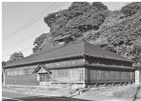
小樽市祝津 茨木家中出張番屋