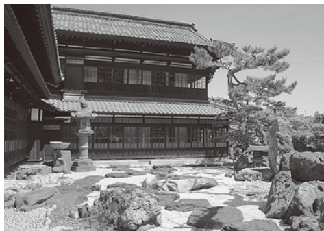
小樽貴賓館(旧青山別邸)