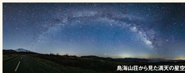
鳥海山荘から見た満天の星空

天気が良ければ 満天の星空を観賞し 鳥海山荘で おいしい食事と 温泉を楽しみます