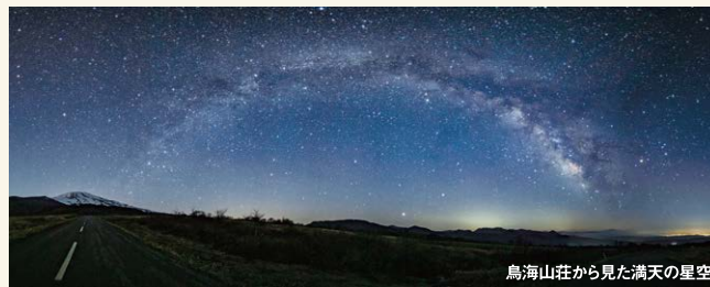
鳥海山荘から見た満天の星空